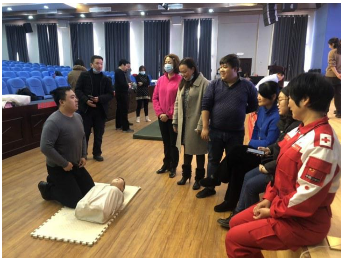
心肺复苏老师现场教学