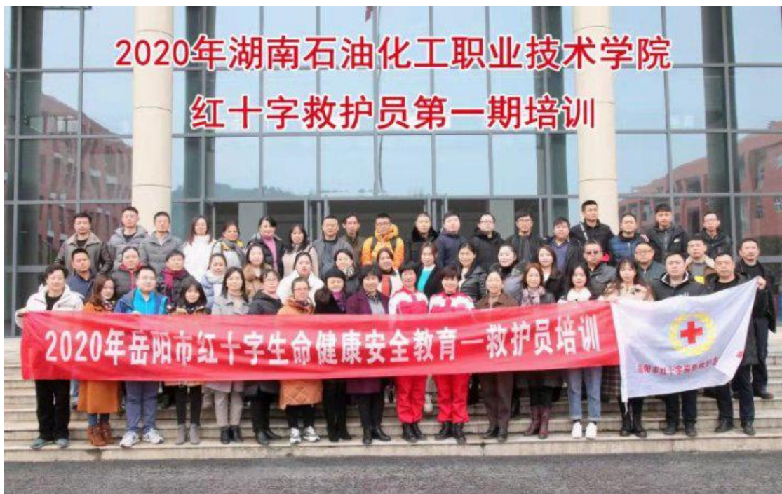
参训人员结业大合照