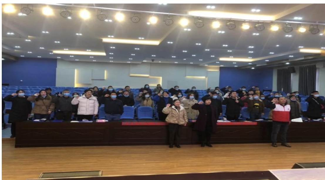
开班--红十字人宣誓

本期培训班的成功举办，不仅拓展了继续教育学院组织开展社会公共安全培训渠道，同时为我院普及应急救护知识培训积累了成功经验，更为后续组织开展大学生应急救护技能培训培训了师资。