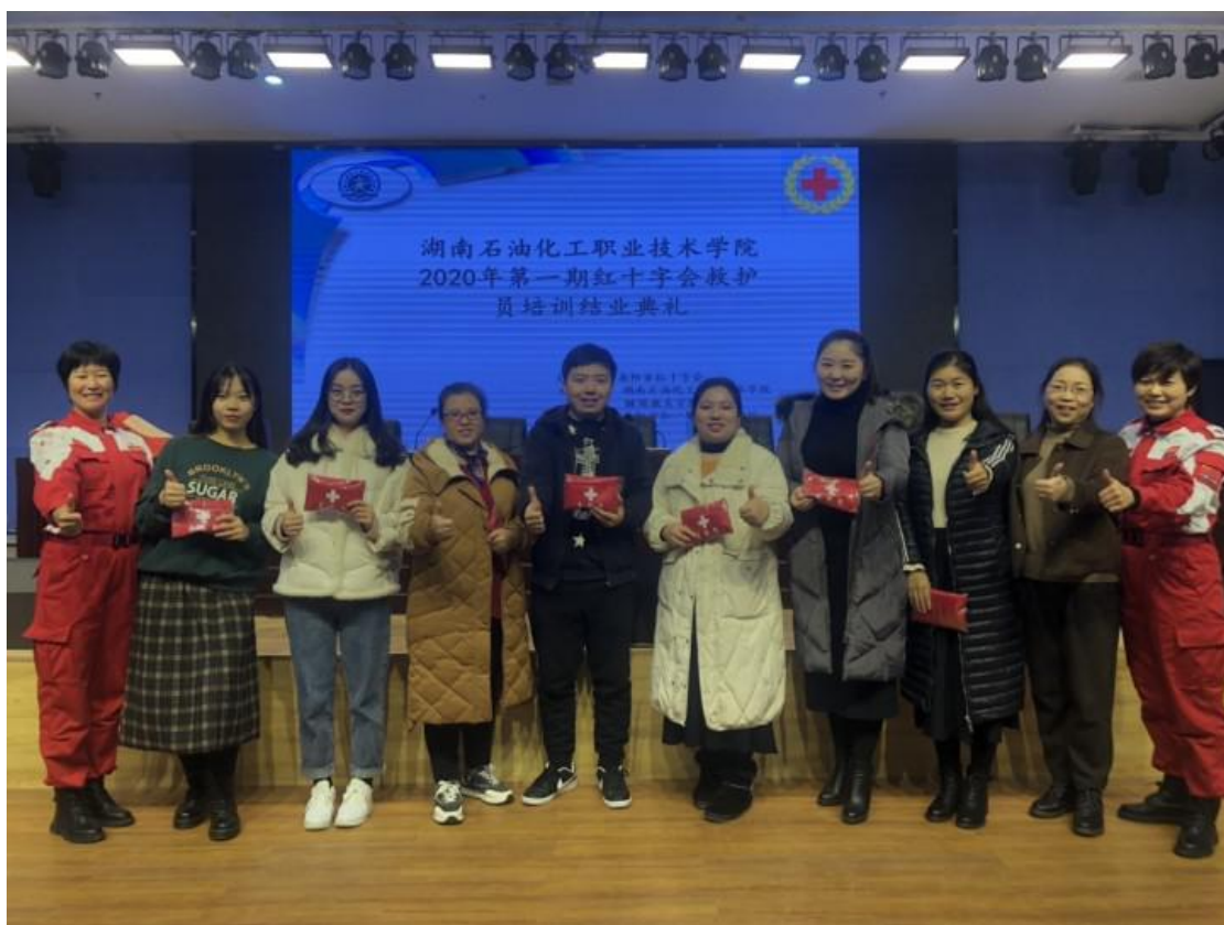
优秀学员与优秀组员